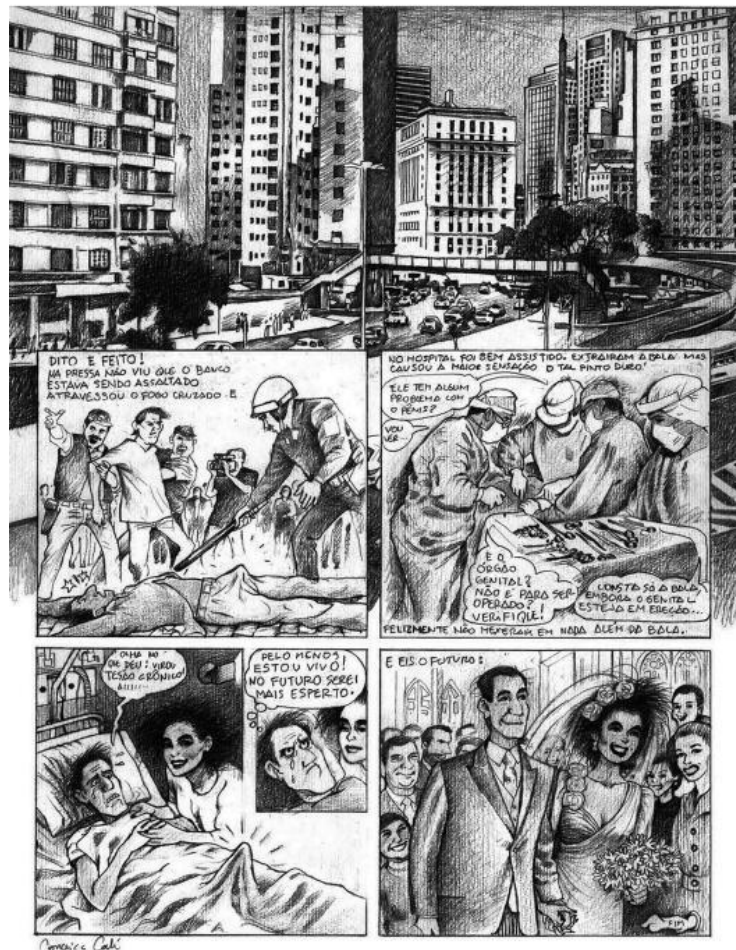
Figura 4 - Página 04 de “Uma História de Amor”

Fonte: CAHÚ, Conceição. Uma História de Amor . Piracicaba: Salão de Humor de Piracicaba, 2019.