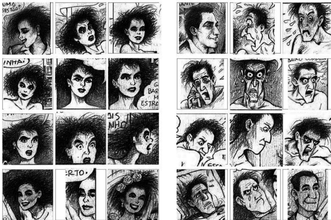
Figura 5 -Análise de quadros de “Uma História de Amor” Fonte: PESSOA, Alberto Ricardo. Montagem do autor para o artigo. 2019.

Ao analisarmos a evolução gráfica dos rostos dos personagens ao longo da narrativa iremos verificar que apenas o homem passa por um processo cômico de caracterizado pela estilização.