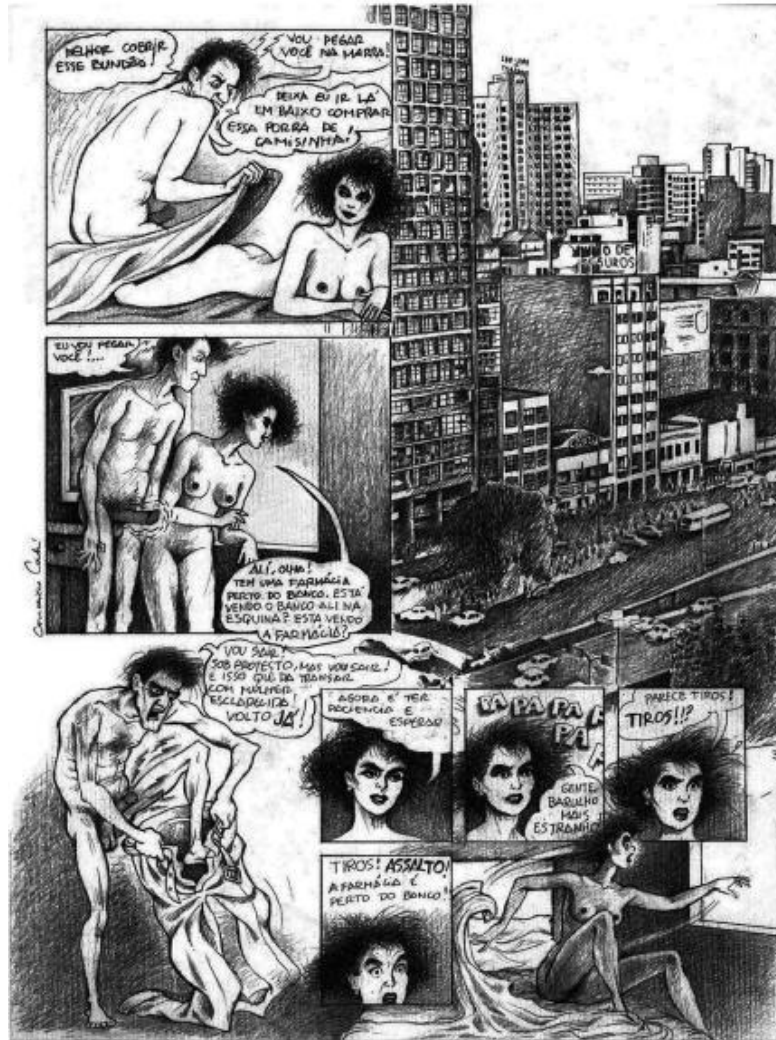
Figura 3 - Página 03 de “Uma História de Amor”

Fonte: CAHÚ, Conceição. Uma História de Amor . Piracicaba: Salão de Humor de Piracicaba, 2019.