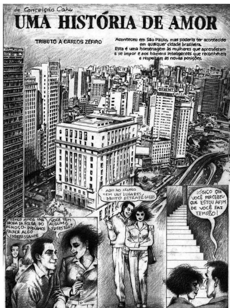
Figura 1 - Página 01 de “Uma História de Amor”

meio de comunicação. O vermelho que moldura o casal que está prestes a ter uma relação sexual é um exemplo do uso da cor como comunicação.