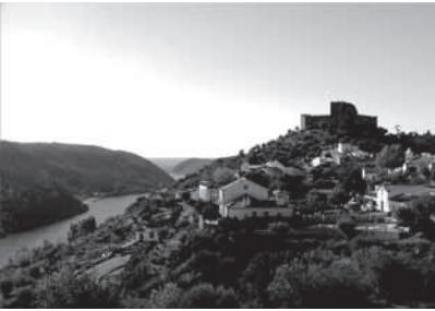
Figura 2: Vista panorâmica de Belver, com o castelo medieval em segundo plano.

Confrontada com esta problemática, a Câmara Municipal do Gavião optou claramente por rentabilizar os recursos naturais, paisagísticos e patrimoniais do seu concelho, que se situam sobretudo em Belver, apetrechando-o com um diversificado conjunto de equipamentos e de ações com finalidades de lazer e turismo. Esses equipamentos – tão diversos como uma praia fluvial, um hotel com atividades desportivas – e ações – como a reestruturação do largo da igreja e a intervenção de restauro do Caminho da Fonte Velha : um antiquíssimo caminho medieval que ligaria o centro da vila a uma das suas periferias rurais – foram suportadas, em parte, por projetos comunitários. Contaram com assessores técnicos e mediadores capazes de dar resposta a suas solicitações, através de concursos públicos. Daqui advém, como enunciaremos mais à frente, o início de uma forte intencionalidade e disposição programática por parte de quem tem o poder de decidir: os políticos (autarcas locais), logo seguidos pelos arquitetos e... pelos artistas (escultores).