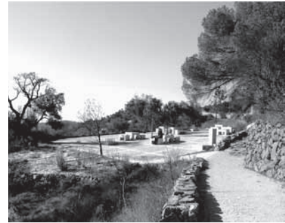
Figura 6 e 7:

Desse modo, todo o espaço que define o Caminho da Fonte Velha foi o suporte de intervenção dos cerca de trinta elementos escultóricos referidos que, em sua diversidade e por si só, não chegavam a ascender ao estatuto de objeto. Como outrora, a escultura inserida na arquitetura só vivia quando inserida no suporte arquitetônico. Esses elementos escultóricos, só vivem quando inseridos num suporte que, no caso deste