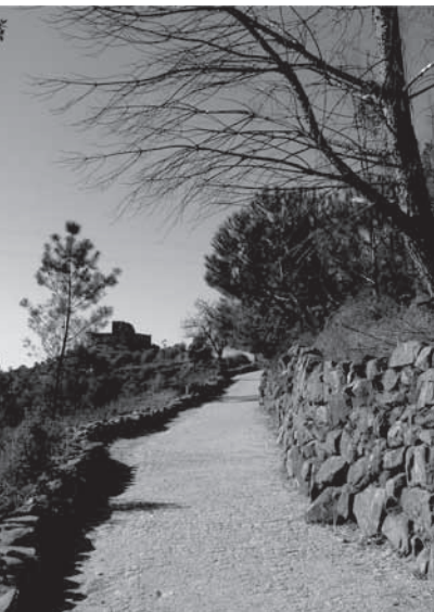
Figura 5: Trecho do Caminho da Fonte Velha , com o castelo de Belver em segundo plano.

relação à vila, sobranceiro ao rio Tejo, assumindo-se quase como uma escultura de vulto perfeito. Contrapondo o castelo (fig. 2), o caminho da fonte (fig. 5) desenvolve-se ao logo da encosta, de um forma mais discreta, por vezes imperceptível, camuflado pela vegetação que o acompanha (fig. 3 e 4). Poderíamos afirmar, se falássemos apenas a partir do âmbito da teoria da escultura, que o castelo poderia ser um monumento, participando na vida diária da população desta vila apenas como objeto visual e, o caminho da fonte, uma instalação participada pelas funções exercidas ao longo do seu percurso, durante séculos. Dessa forma, afirma-se o forte caráter deste lugar e reivindica-se a tensão entre objeto (o castelo) e espaço (o caminho da fonte) que polariza a paisagem e determina a sua interessantíssima dimensão cênica.