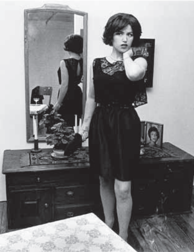
FIGURA 4: Cindy Sherman Untitled Film Still #14 , 1978. fotografia