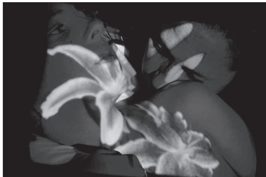
Figura 3 Equilibrium , 2008.

Com o deslocamento de foco do objeto para o processo, investe-se, dessa maneira, em um mergulho temporal. Quebramos a magia da obra fechada e de um tempo cristalizado para nos arriscarmos nos devaneios da complexidade e da emergência. Vivemos o momento das conexões e da emancipação de organismos hiperconectados. Considerando-se processos que hibridizam sistemas naturais e artificiais, como no caso de Bot_anic , iremos notar, de forma ainda mais enfática, que se trata menos da construção de um produto final do que de uma amostragem contínua de pos-