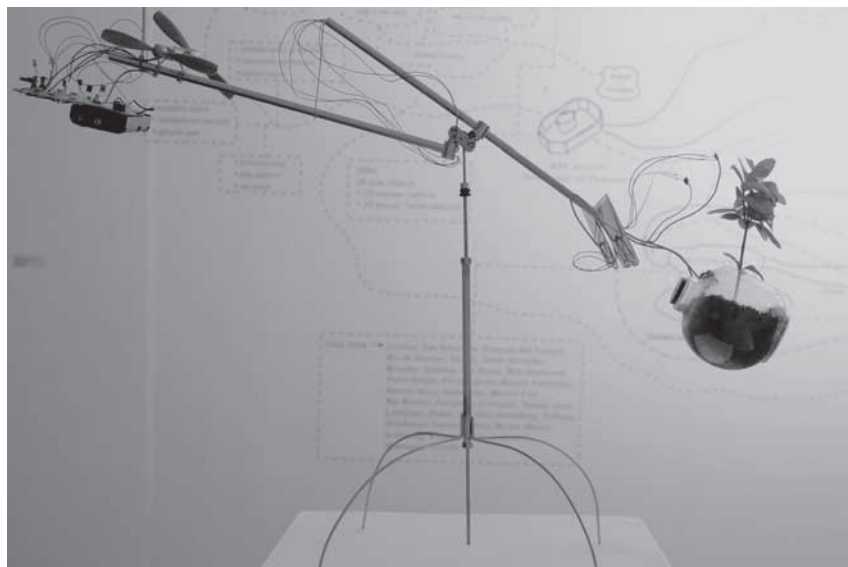
Figura 4 Breathing , 2009.

Artigo recebido em 28 de outubro de 2013 e aprovado em 18 novembro de 2013.