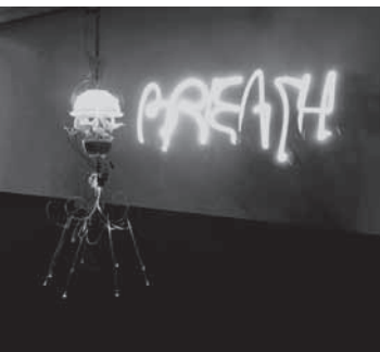
Figura 2 Breathing , 2009.

O gradual deslocamento do foco no objeto de arte para o conceito de sistema implicou num mergulho cada vez mais profundo nos processos, posto que os mesmos são determinantes no comportamento dos sistemas e seus estados. Portanto, os processos nos parecem ser força motriz a serviço da linguagem na arte. Contudo, com a efetiva penetração do dispositivo estético, pela aparelhagem técnica 12 , como já fora previsto por Walter Benjamin 13 , dispositivo este que agora é hiperativado pela capacidade conectiva das redes, e dado à ubiquidade dos sistemas de prototipagem rápida, nos vemos diante de um novo fenômeno. Tereza Cruz, em seu artigo “Da nova sensibilidade artificial” nos aponta que: