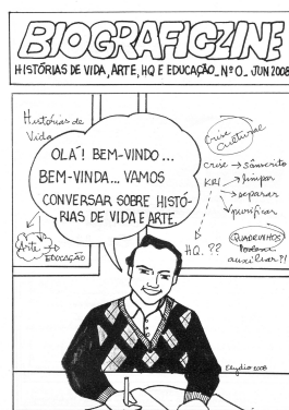
Fig. 8: Biograficizine n. 0

A partir de então, mais histórias em quadrinhos de tal gênero poético passaram a ser publicadas, sendo nalgumas vezes introspectivas e até surrealistas (e/ou non-sense ), como as de Henry Jaepelt e Antônio Amaral, ou mesmo de autoconhecimento, como as de Flávio Calazans, e mais recentemente as de Elydio dos Santos Neto (Figs. 5, 6 e 7), que elaborou os Biograficzines (Fig. 8), cujo conceito foi criado para que pudesse ser usado também no ensino.