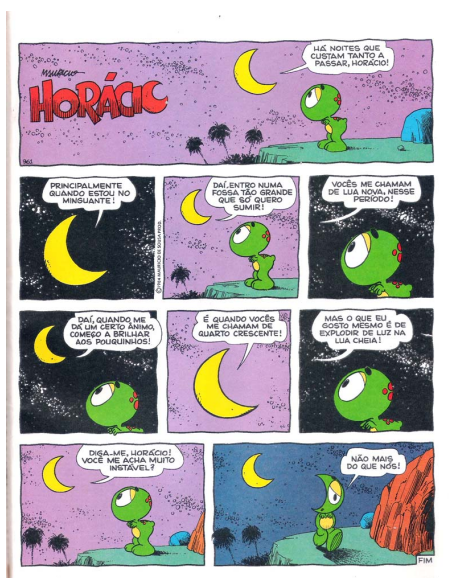
Fig. 1: Horácio. Fonte: SOUSA, Maurício de. Horácio e seus amigos dinossauros . Rio de Janeiro: Globo, 1993.

de jornais e nos gibis à tradução de quadrinhos estrangeiros, como os de Walt Disney (com uma parte sendo feita no Brasil), Super-Heróis e o mais aclamado autor nacional com amplo alcance, Maurício de Sousa e sua Turma da Mônica, em que há o dinossauro Horácio – filosófico e alter-ego do autor (fig. 1), além de parques materiais brasileiros em bancas.