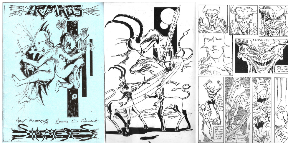
Figs. 2, 3 e 4: Capa e páginas internas do zine “Irmãos Siameses e páginas de E. Franco (fig. 3) e G. Andraus (fig. 4).

Nesse caso, pode-se atribuir uma categoria narrativo-literária às HQs, dentro do gênero literário, apesar de que as histórias em quadrinhos per si não são literatura (e vice-versa), já que ambas as expressões possuem estruturas próprias em suas linguagens díspares (uma usa principalmente imagens desenhadas, enquanto que a outra utiliza fonemas narrativos).