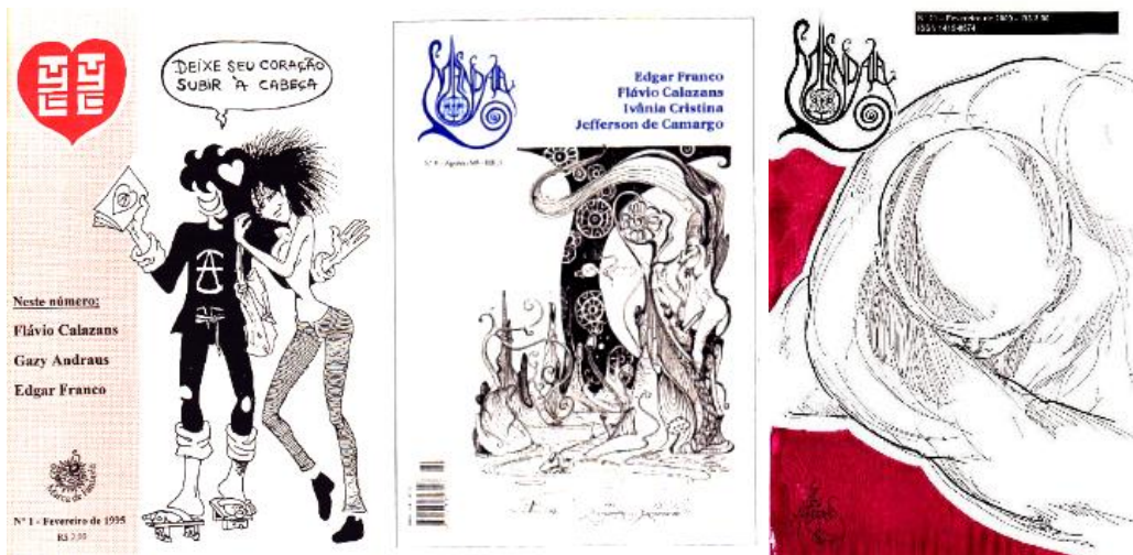
Figs. 9, 10 e 11: Fanzine Tyli-Tyli que veio a se chamar Mandala, editada pela Marca de fantasia