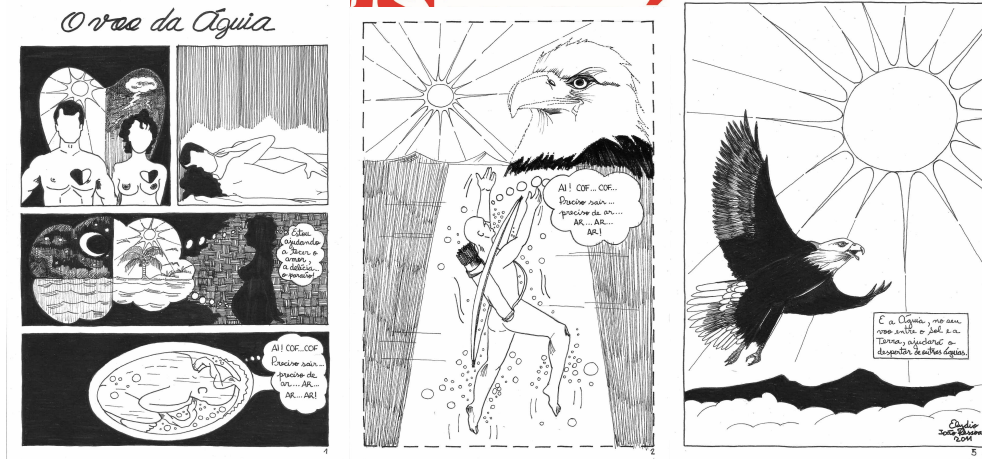
Figs. 5, 6 e 7: Trechos da HQ “O Voo da água”. Fonte: Gibiozine, n. 14, UFSCAR, 2015.

histórias em quadrinhos curtas (com média de 3 a 6 páginas por autor), o que também – e muito provavelmente – auxiliou no desenvolvimento de algumas histórias em quadrinhos curtas, elípticas, em que o embrião das HQs poéticas foi se alojando e crescendo, até resultar em um dos gêneros nacionais poéticos de quadrinhos.