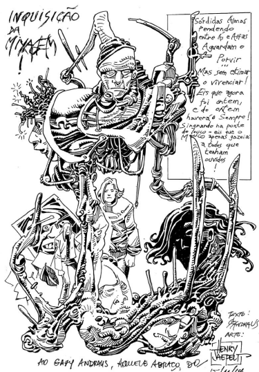
Fig. 14: Página de H. Jaepelt para poesia de Andraus.